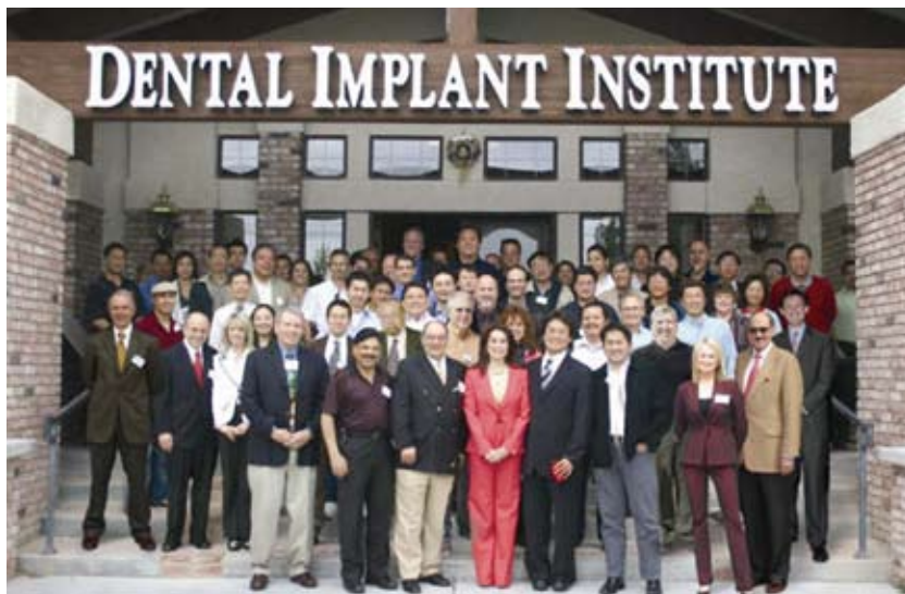
与众多来听讲的医师教授在学院前合影

2008年，台湾领导人马英九在台北的盘石奖大会上亲自为陈俊龙博士颁发了奖状，盘石奖在台湾是个大奖，它的评定其严格程度几乎就象对上市公